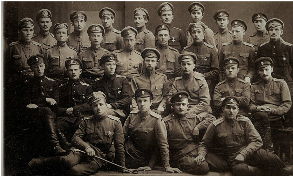
7. Bauskas latviešu strēlnieku pulka virsnieku grupa pēc izlaišanas no lielinieku ieslodzījuma. Valmiera, 1917. gada 9. (22.) novembris.

12. armijas izpildkomitejā (Iskosolā) līdzvērtīgas pozīcijas saglabāja sociālrevolucionāri (eseri). Nu bija pienācis brīdis pilnībā pārņemt armiju.