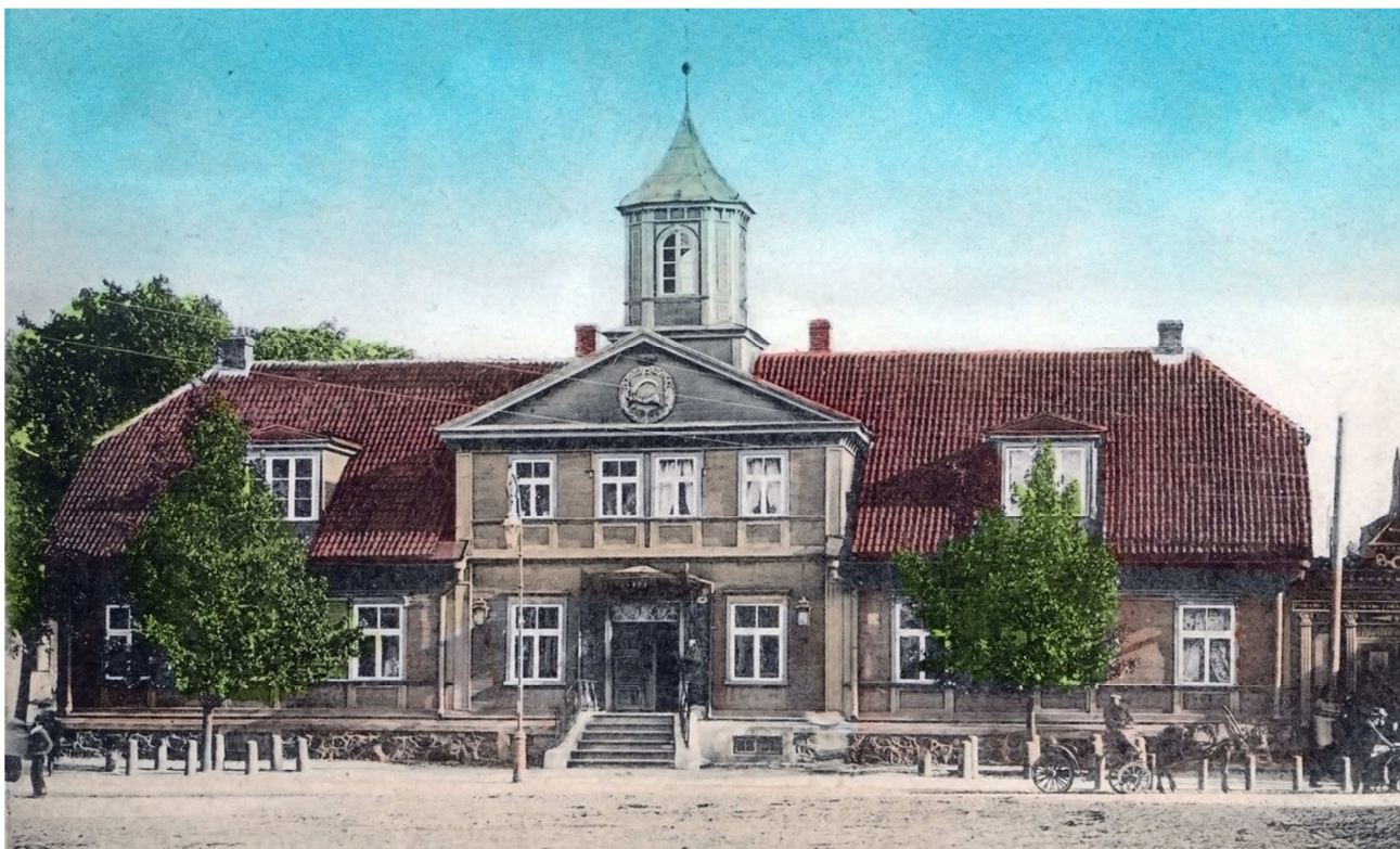
Valkas pilsētas valdes ēka.

Valka 1917. gada rudenī kļuva par latviešu sabiedriskās un politiskās dzīves galvaspilsētu. Rīgu tobrīd bija ieņēmusi Vācijas armija, un tur legāla politiska darbība nebija iespējama. Tādējādi Valka, kas atradās pietiekami tālu no frontes un bija nozīmīgs transporta mezgls, kļuva par Latvijas politiskās dzīves centru.